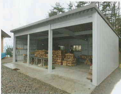
薪作業用倉庫新設