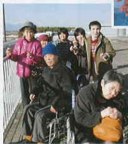
「松本空港日帰り旅行」大きな飛行機見たよ