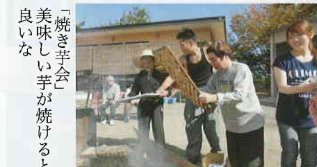
「焼き芋会」美味しい芋が焼けると良いな