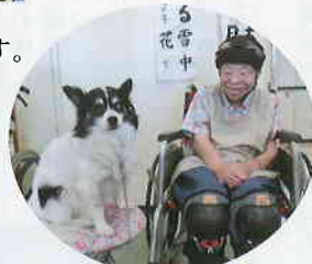
「アニマルセラピー」わんちゃんかわいいな