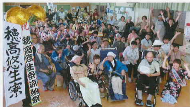
「納涼祭」また来年も楽しい納涼祭が待ち遠しい