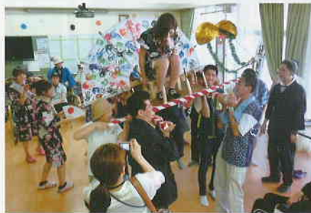
「納涼祭」お神輿ワッショイ！職員が手作りしたお神輿です。