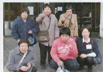
浅間温泉一泊旅行に行ってきたよ！

穂高悠生寮でお仕事をさせて頂いていた三カ月が経ちました。利用者さんに顔と名前を覚えていただき、たくさんお話することが出来てとても楽しいです。まだまだ周りの方にたくさん迷惑をかけてしまっていますが、笑顔で頑張っていきたいと思えます。よろしくお願ひします。