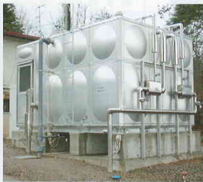
給水受水槽移設新設