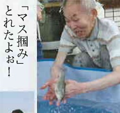
「マス掴み」とれたよお！