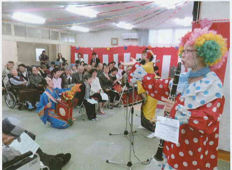
「チンドンや」楽しかったね 「チンドン! あづまや」の皆さん