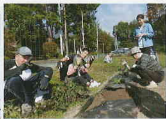
「野菜収穫」いっぱい取れた！