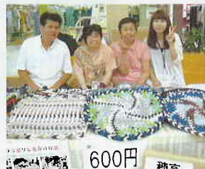
「ナイスハートバザー」600円いっぱい売れたよ！