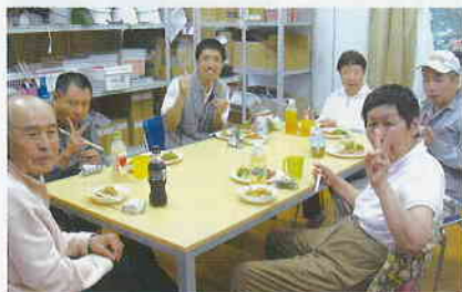
みんなでバーベキューしたよ