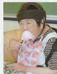
「デザートバイキング」綿飴うめえ〜